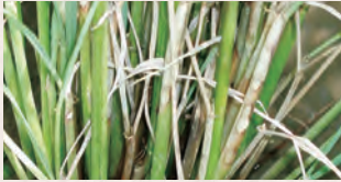
紋枯病の症状(株元の様子)

紋枯病の初発生は最高分げつ期〜幼穂形成期頃で、気温の上昇と共に病斑の進展が速くなり、気温が低下するにつれて病勢は衰えていきます。しかし、近年は長期間に渡って高温で経過することが多いため、ほ場での発生拡大に注意し、状況に応じて防除を行うことが重要となります。また、前年作で多発したほ場では、菌核による初期の感染拡大を軽減するための対策として、移植時に紋枯病に登録のある箱施薬剤を使用することも効果的です。