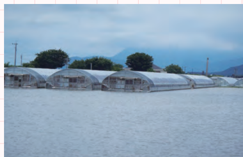
豪雨による水害の様子

平成29年九州北部豪雨から 5年連続で数十年に一度と言われるような降雨による水害 が発生