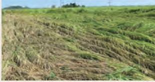
紋枯病による倒伏

病害虫防除所では、ウェブサイトとTwitterで情報発信を行っています。ぜひご確認ください。