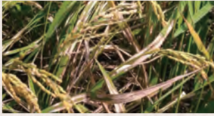
紋枯病の症状(葉身の枯死)