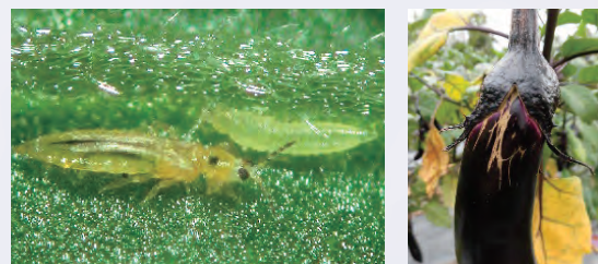
図1 ナスの果実を加害するミナミキイロアザミウマ

春から夏にかけて気温が上昇すると、病虫害の発生も多くなります。特に、ナス、ピーマンでは、果実を加害するアザミウマ類が発生します。梅雨時期には、病気の発生も増えてきます。このような病虫害は、生育が軟弱・徒長気味になっている場合に被害が発生しやすくなります。病虫害が発生する前に、こまめな整枝・せん定や下葉の除去等の適正な栽培管理に努め、早めの病虫害対策を徹底して下さい。